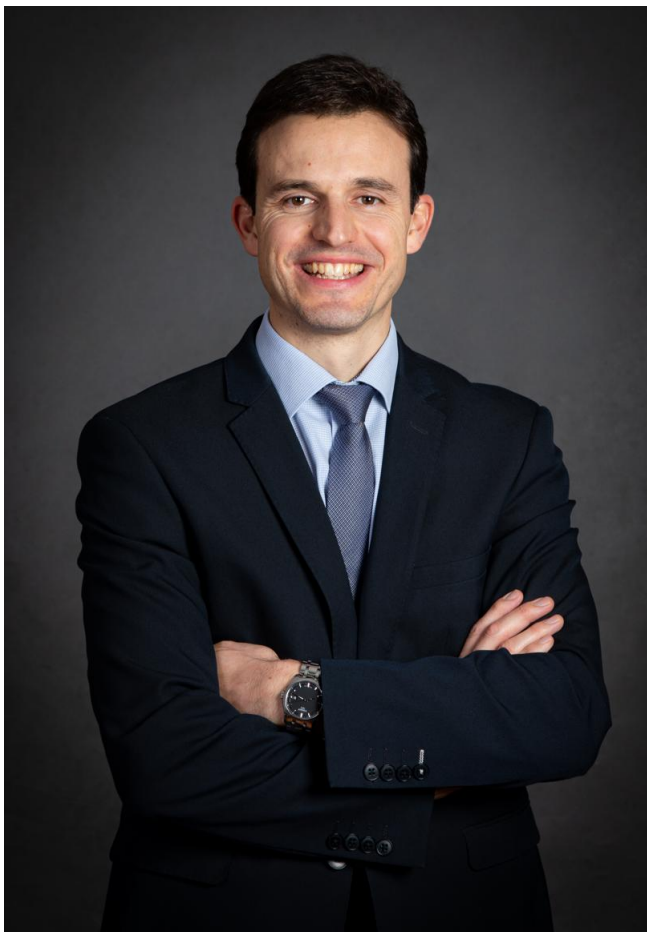
Dimitri Lahuerta, maire de Belley.

Dimitri Lahuerta, maire de Belley, dont la municipalité accueillait le départ et l'arrivée de l'Aindinoise, revient sur cet événement d'envergure ainsi que sur la pratique du vélo et les projets qui en découlent au sein de sa ville.