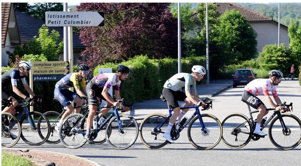
Passage à Virieu-le-Grand pour tous les coureurs.