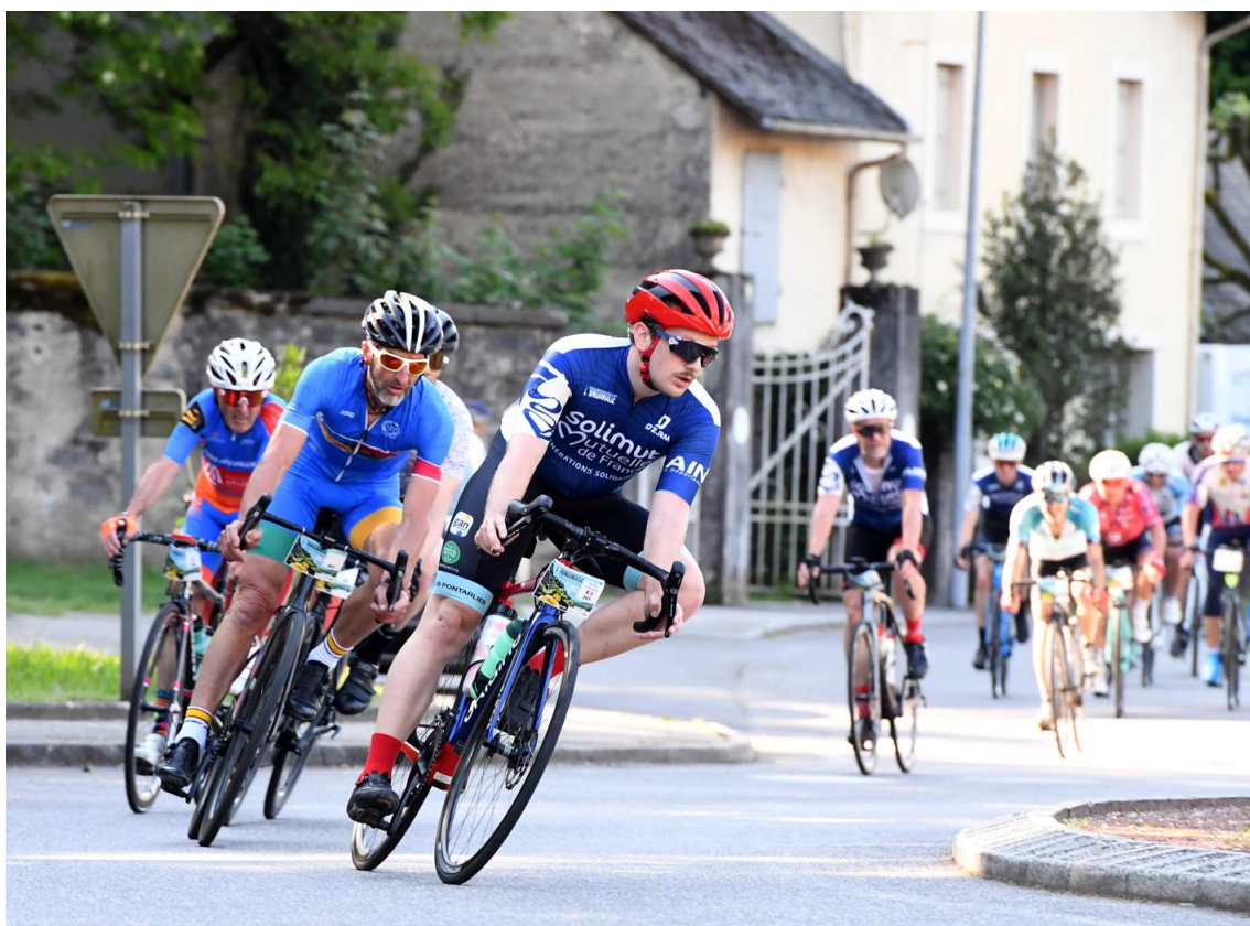
Des participants de tous les âges ont participé à cette 4 e édition de la cyclo sportive du département de l'Ain.