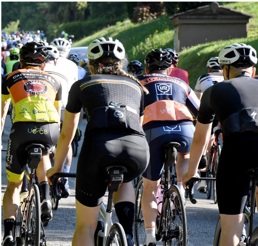
Hommes et femmes étaient mélangés dans cette 4 e édition de l'Aindinoise.