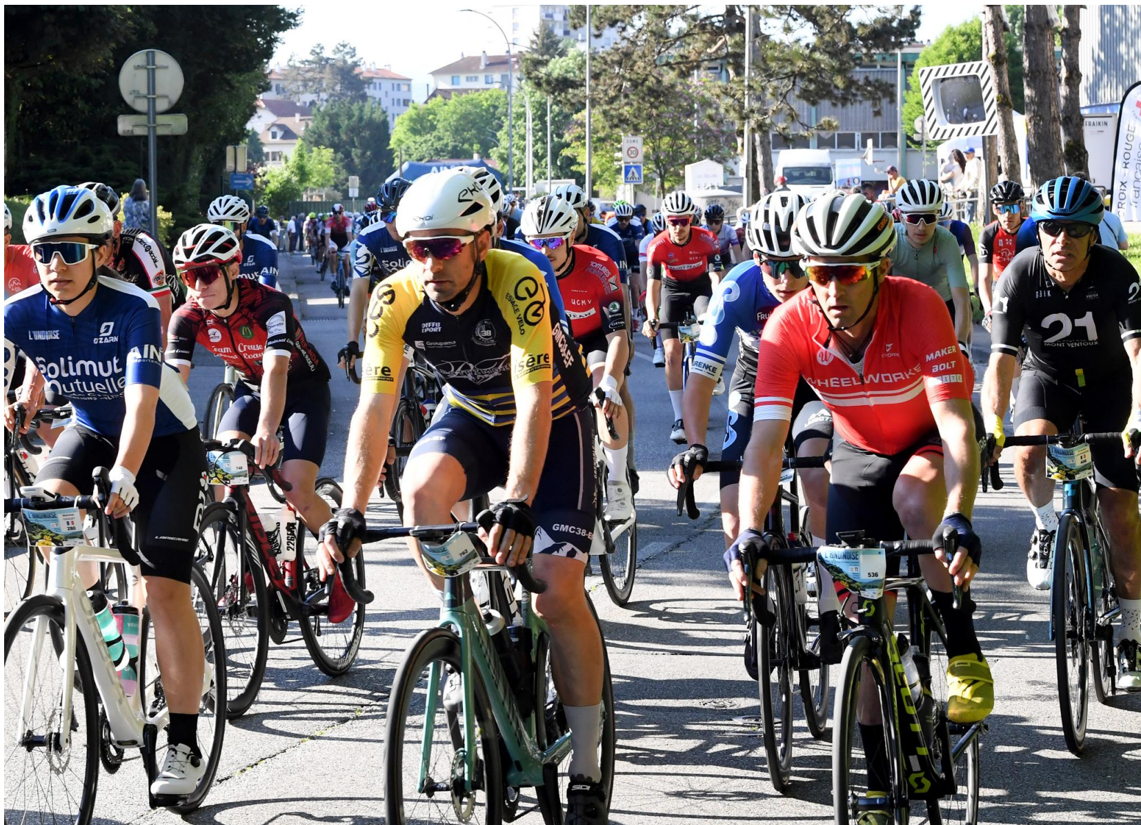
847 cyclospor­tifs au départ commun des trois courses au programme.