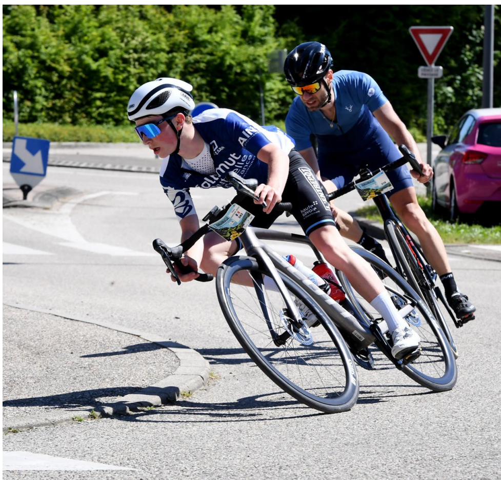
Dernier virage avec l'arrivée en point de mire.