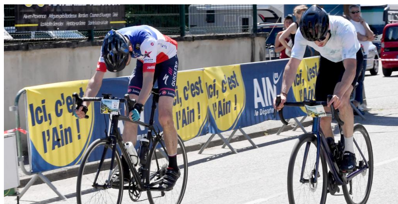
Bagarre sur la ligne d'arrivée.