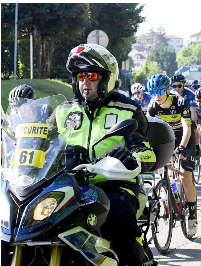
Les motards présents pour assurer la sécurité.